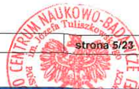
Tabela nr 3.