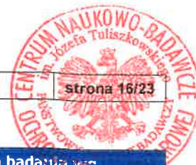
Tabela nr 8.