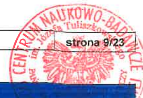
Tabela nr 6 (2/2).