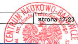
Tabela nr 9 (2/2).